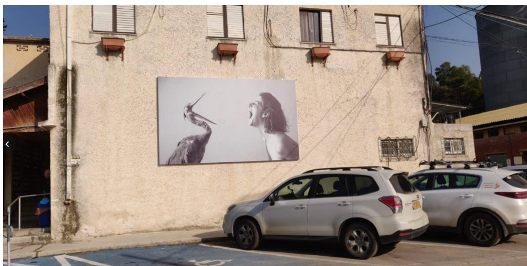
הצילום על הקיר הדרומי של בניין הצרכנייה

גם אל סידור האוסף היא מתייחסת באופן חתרני: בשונה ממוזיאונים העוסקים במיון, ארגון וקטלוג, ומסדרים את אוסף המוצגים במערכי ידע שמייצרים משמעות ומספרים סיפור - בראור פועלת בתוך המרחב המוזיאלי כפורעת סדר, ומתוך התנגדות למעמדו ההגמוני של המוזיאון ולחוקיו. היא בוחרת ומרימה אובייקטים מהתצוגה, ומגיבה אליהם באופן אינטואיטיבי באמצעות הגוף והחושים. בכך היא מציעה יחס של סקרנות, תשוקה ומשחקיות, על פני צפייה בהם כאובייקטים של ידע. הנכחת גופה החי והפגיע של האומנית בתוך המוזיאון, חותרת תחת המאמץ המוזיאלי להקפיא את הזמן ולמנוע את המהלך הטבעי של כל היצורים: להתפורר ולהתכלות.