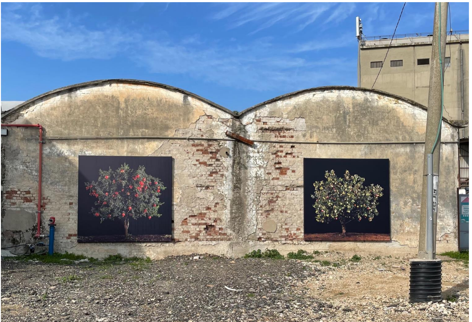
הצילומים על קיר בית האריזה הישן

העבודות מוצבות על הקיר החיצוני של בית האריזה הישן של המושב, שנבנה במרכז הכפר בשנות ה-30 של המאה הקודמת. בית האריזה והמחלבה הצמודה אליו היו הלב הפועם של הייצור החקלאי בכפר. יבולי השדה והרפת הובלו לכאן, נשקלו, נארוזו ונשלחו ל"תנובה". מזה זמן רב הבניין אינו משמש לייעודו המקורי, ולאחרונה שופץ חלקו והפך למשרדים מעוצבים.