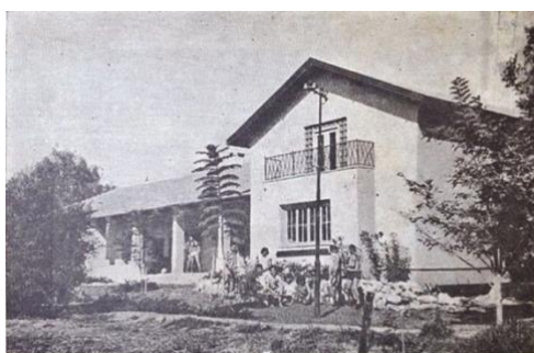
בית-חנקין בשנת 1950

האוסף, שנצבר בשיתוף תלמידי ביה"ס והתושבים, אורגן מחדש כמה פעמים במהלך השנים, אך המבנה