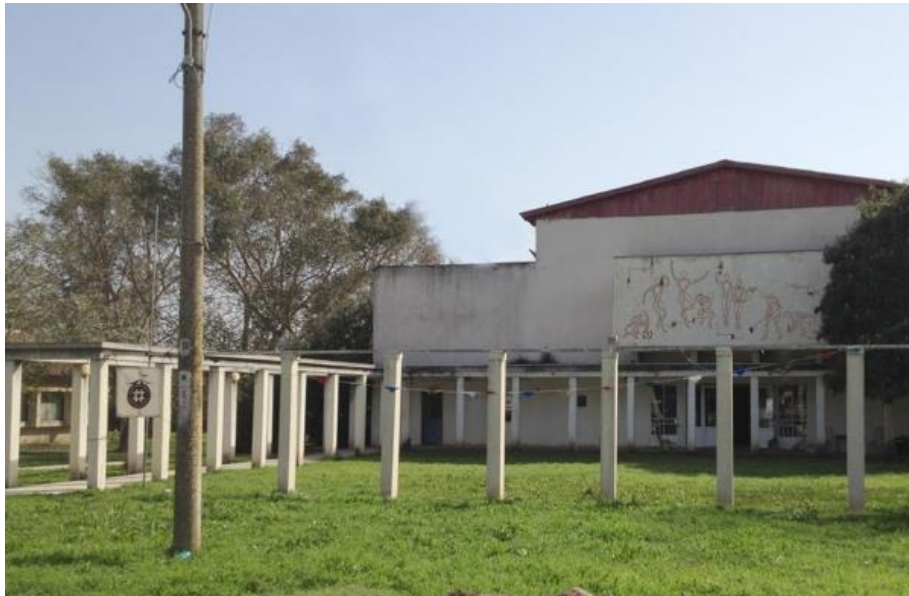
ציור הקיר בחזית בניין בית העם בכפר יהושע

בימי ראשית המדינה צמחה בארץ אמנות קיר, שתכניה שימשו לביסוס הרוחני והתרבותי של המדינה החדשה, ולבניית זהות לאומית קולקטיבית. תבליטים בטכניקות שונות כמו בטון, קרמיקה, פסיפס, ברזל או סגרפיטו (Sgraffito) וציורי קיר, הופיעו על גבי מבני ציבור ומוסדות שלטון. העבודות תיארו את בניין הארץ, או נושאים תנ"כיים כמו שבעת המינים, חגי ישראל וכו'. לפרויקטים הללו גויסו מיטב האמנים, רובם אנשי המקום.