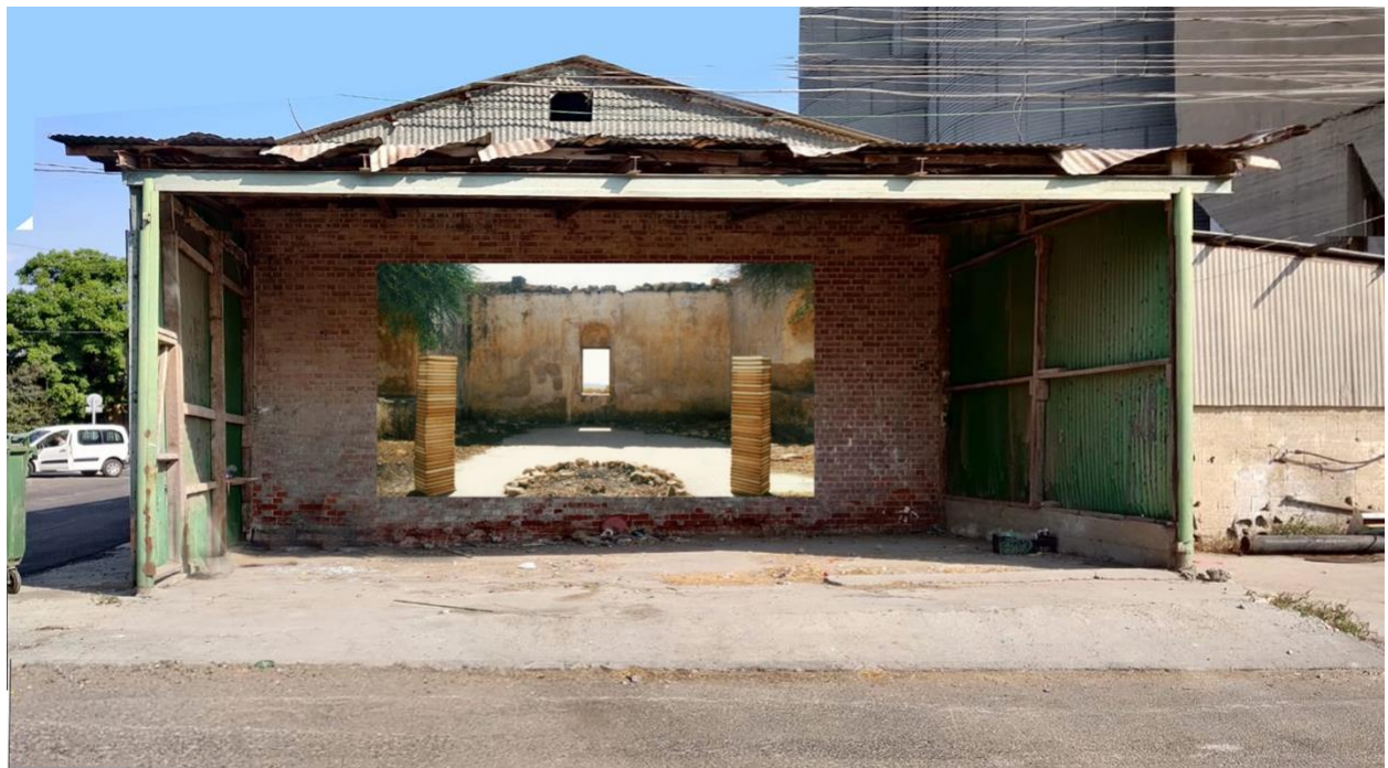
הצילום בתוך סככת המיחזור

המשקיף על הדרך לירושלים, ששרידיו מעידים על תרבות ופאר שהיו ואינם עוד. בצילום, שנראה כתיעוד של אתר פולחן עתיק, נערך החלל באופן סימטרי ומזכיר טקס קבורה או זיכרון. הספרים הכבדים סודרו בשתי ערמות כשרידים ארכיאולוגיים, כעמודי תווך שתפקידם תם. התקרה החסרה הותירה את המטען התרבותי ללא קורת גג. שרידי מדורות עזובות סודרו לכדי מעגל מרכזי, המעלה זיכרון מר של שריפת ספרים ומחיקה תרבותית. הצבת הצילום בסככה הישנה יוצרת תחושת תעתוע, וקשה להפריד בין המבנה הממשי למבנה המצולם.