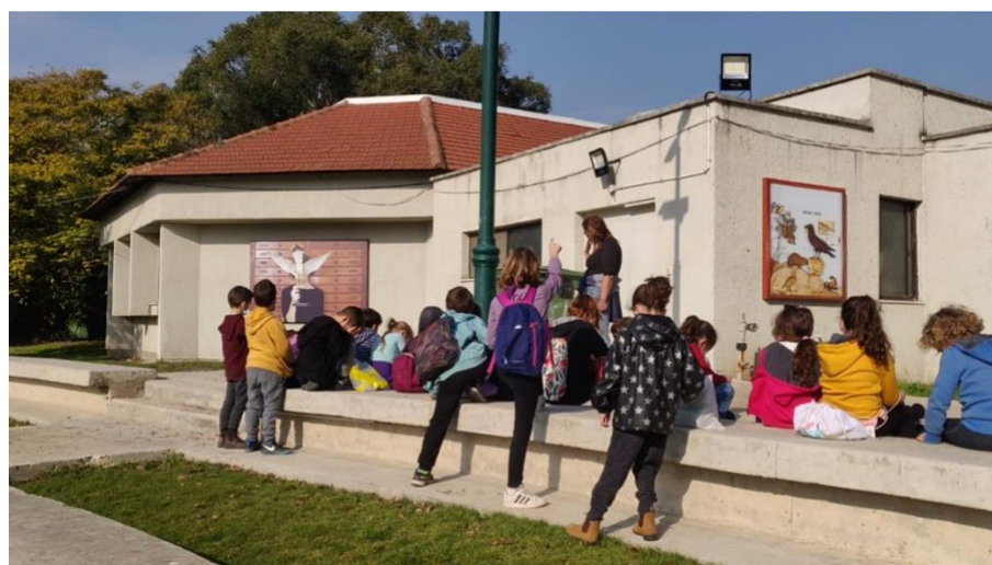
תלמידי בית-ספר מבקרים בתערוכה